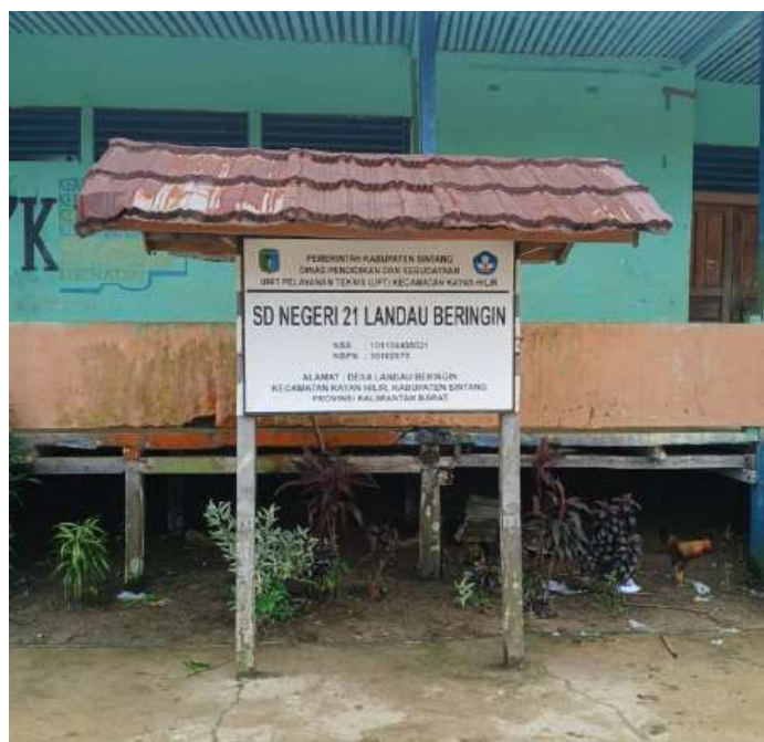
Gambar 4.1. Plang Nama SD Negeri 21 Landau Beringin

Sekolah Dasar Negeri 21 Landau Beringin didirikan pada tanggal 25 Juni 1983 berdasarkan SK Pendirian Sekolah, dan berada di bawah naungan Pemerintah Daerah. Sekolah ini berstatus negeri dengan bentuk pendidikan SD dan menggunakan Kurikulum Merdeka dalam kegiatan pembelajarannya. Berdasarkan data rekapitulasi semester genap tahun pelajaran 2024/2025 per tanggal 1 Juli 2025, SDN 21 Landau Beringin memiliki total 5 pendidik dan tenaga kependidikan (PTK) yang terdiri dari 4 guru dan 1 tenaga kependidikan, serta 61 peserta didik yang terdiri dari 38 siswa laki-laki dan 23 siswa perempuan. Kegiatan pembelajaran di SDN 21 Landau Beringin dilaksanakan pada pagi hari dan dapat diakses menggunakan berbagai moda transportasi seperti sepeda, sepeda motor, maupun berjalan kaki karena lokasi sekolah masih dapat dijangkau oleh peserta didik dari lingkungan sekitar.