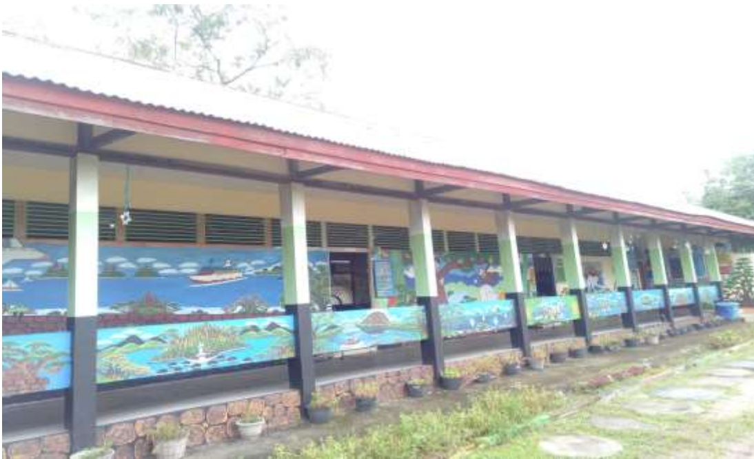
Dokumentasi gedung sekolah