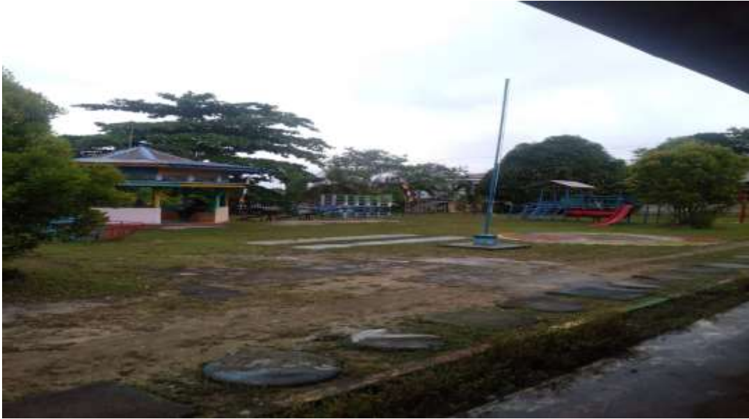
Dokumentasi halaman sekolah