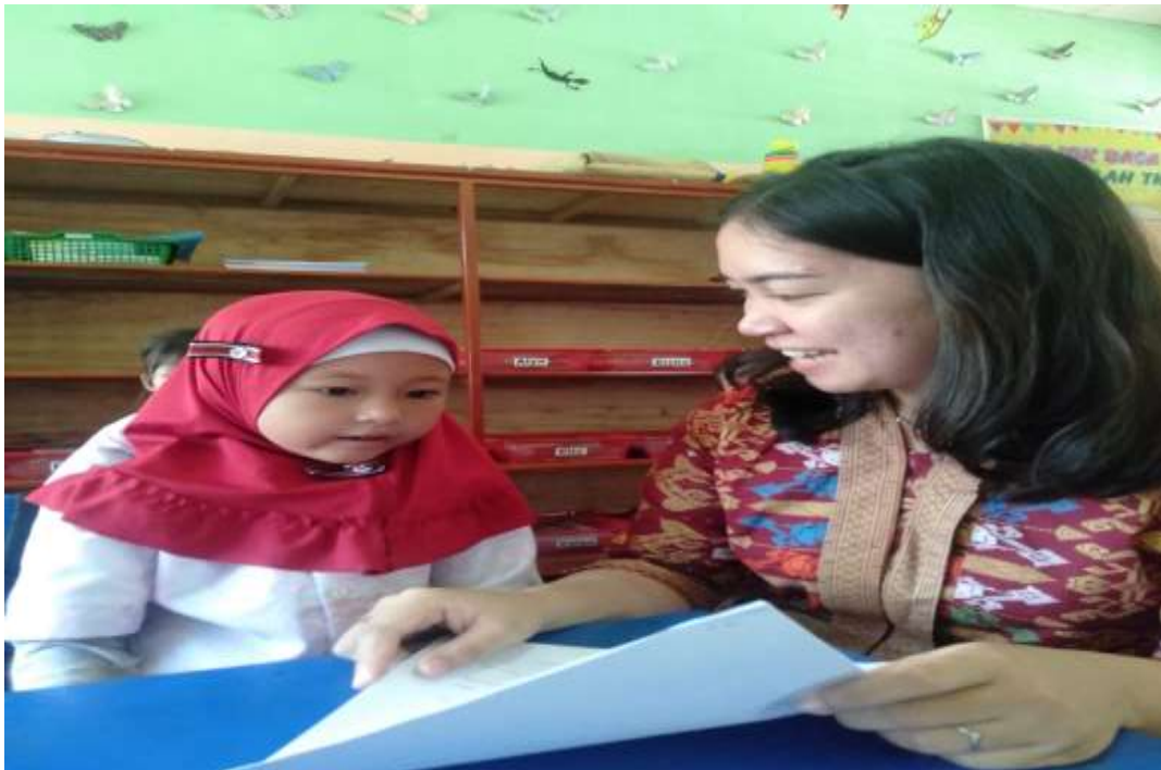
Dokumentasi observasi dan wawancara siswa IP