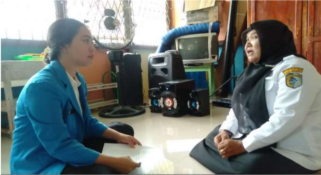
Dokumentasi observasi dan wawancara guru NE