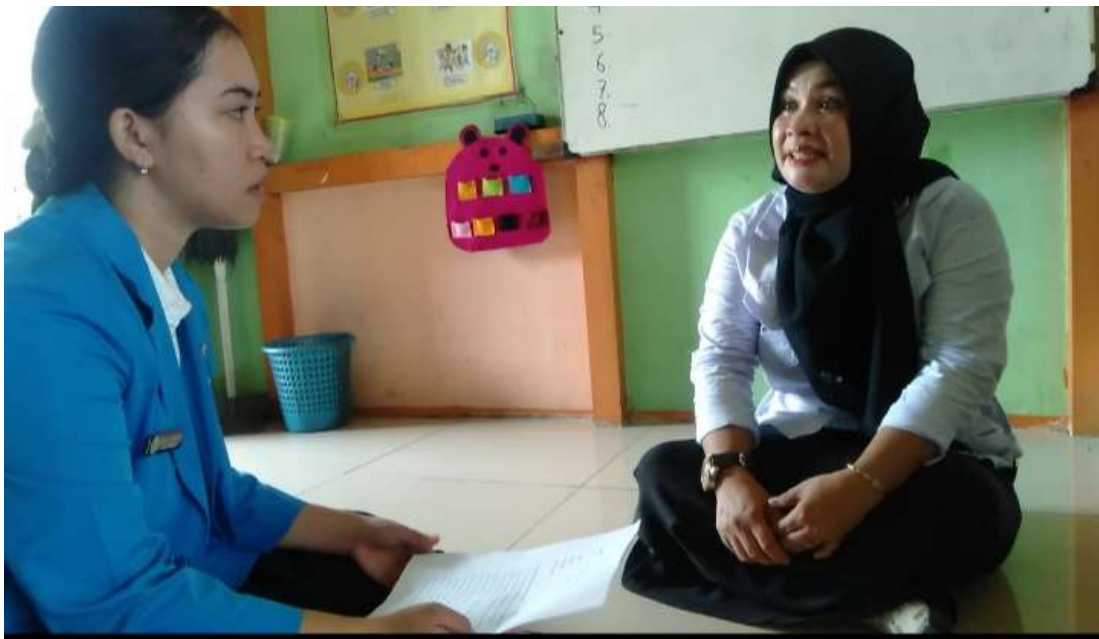
Dokumentasi observasi dan wawancara guru WE