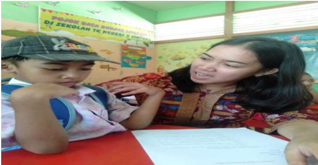
Dokumentasi observasi dan wawancara siswa