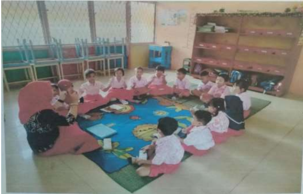
Dokumentasi Kegiatan P5 TK Negeri 5