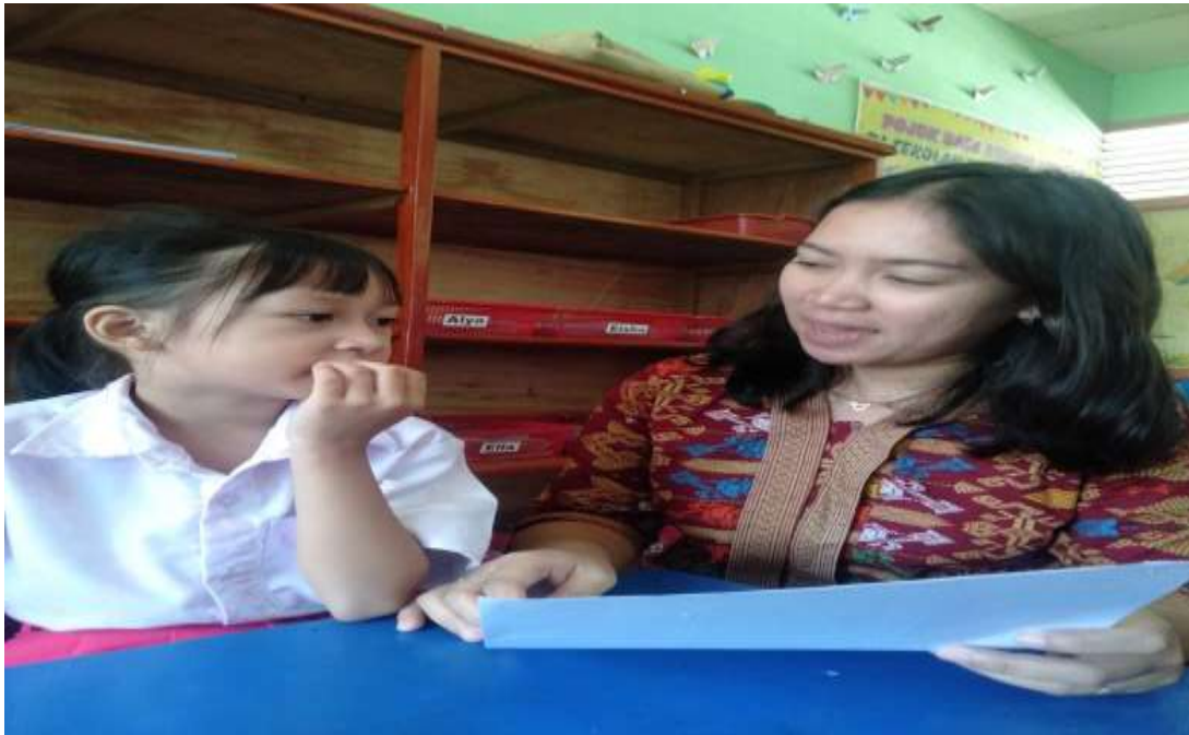
Dokumentasi observasi dan wawancara siswa EI