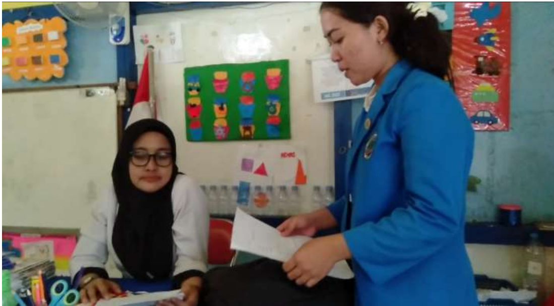
Dokumentasi observasi dan wawancara guru UT