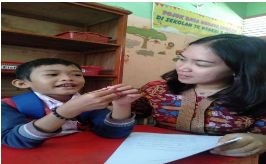
Dokumentasi observasi dan wawancara siswa EI