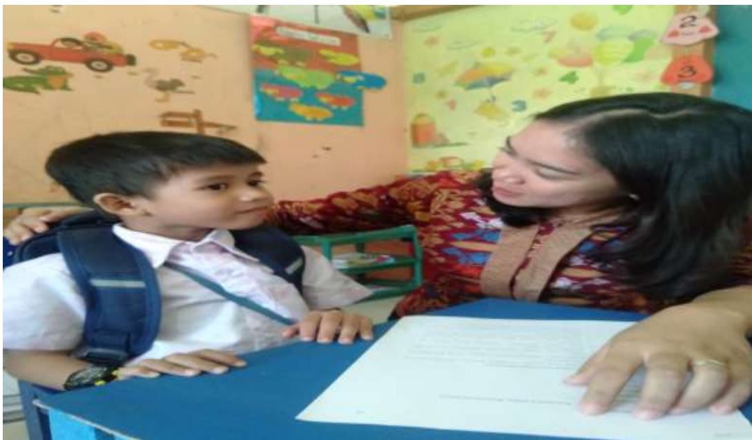
Dokumentasi observasi dan wawancara siswa WL